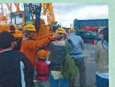
ヘルメットと安全帯をつけましょう！