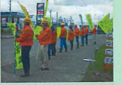
国道にて街頭啓発！皆様安全運転を！