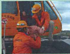
小さなお子様も安全に運転席に♪