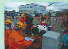
大人気。スカイボックス受付中。