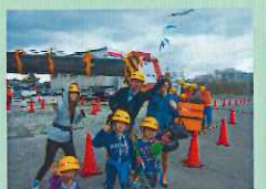
ご家族で記念写真！ハイポーズ♪