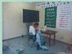
初めてミシンを使ったよ。