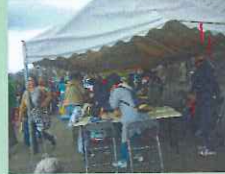
雨、風、日光がしのげるテントをご用意。