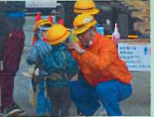
ヘルメット装着！ニコニコ笑顔。