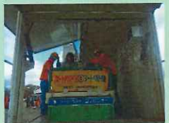
シートベルトをしっかりとつけましょう！