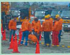
イベント会場セッティング！