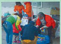
何色のヨーヨーがいいかな？