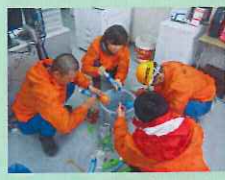
ヨーヨーづくり。楽しいな♪