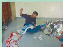
手縫いをし、大事に使うぞ！