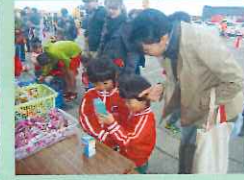
お菓子どれにしようかな？