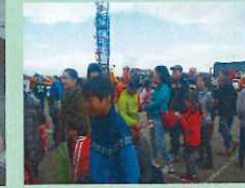
わたあめ、ポップコーンに大行列！！