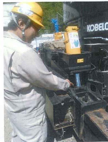
【25 t ラフター 府中ホ°レーター】