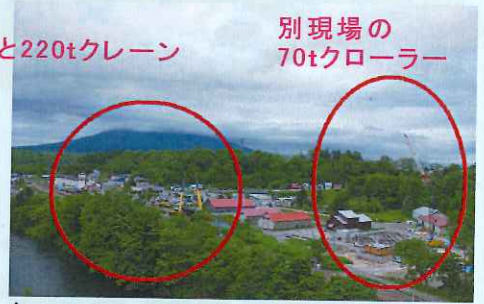
別現場の70tクローラー