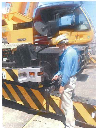
【25 t ラフター 三橋ホ°レーター】