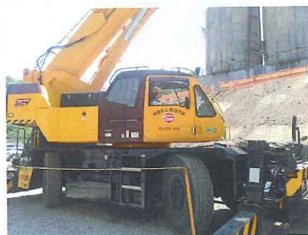
【25 t ラフター 伊藤オペレーター】