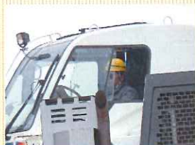
谷口オペも練習中