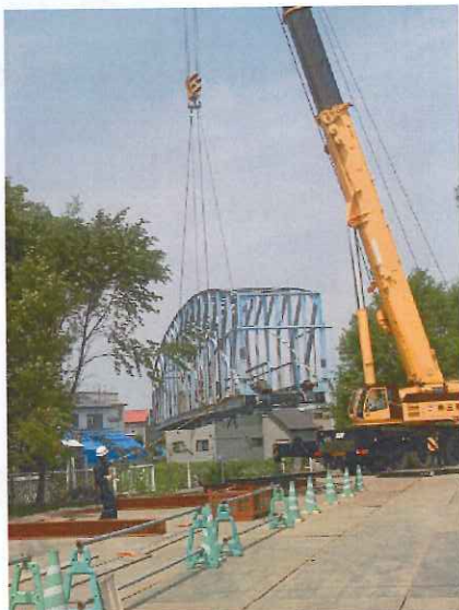
【360 t 佐藤弘昭オペレーター】