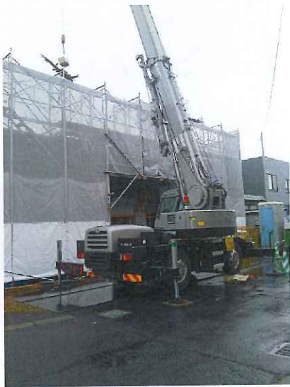
【13 t ラフター 山本祐貴オペレーター】